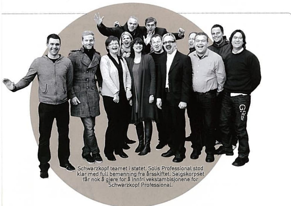
Schwarzkopf teamet i støtet. Solis Professional stod klar med full bemanning fra årsskiftet. Salgskorpset får nok å gjøre for å innfri vekstambisjonene for Schwarzkopf Professional.

Alternativt kan du kontakte Folkeuniversitetet Vestlandet sin avdeling i Haugesund på telefon 5270 43 20, eller du kan ringe til koordinator for mesterbrev i Spania Bård R. Førre på mobil 907 38 623 for mer informasjon.